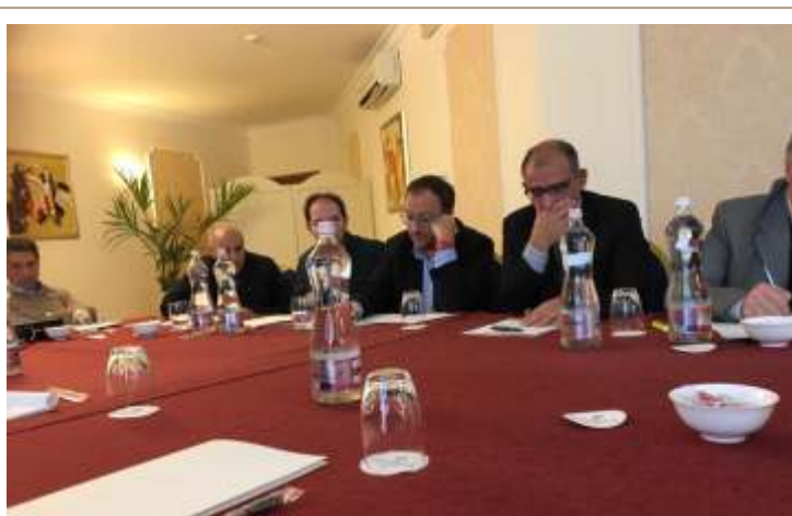
Enna, Federico II Palace Hotel, 1 dicembre 2018