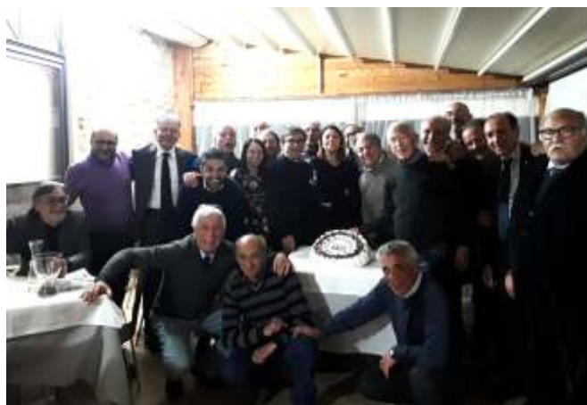
Cena di ringraziamento con i docenti volontari della LUSE di Serradifalco