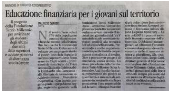
Avenire, 20 luglio 2019