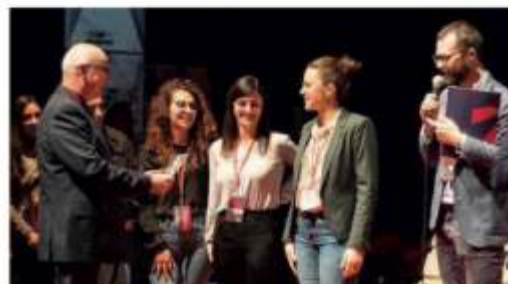
Un momento della premiazione di ieri sera

cui il Santo Padre ha invitato 500 giovani economisti e imprenditori a lavorare per costruire un'economia più giusta. Ed inoltre questa edizione, è anche collegata al Festival Nazionale dell'economia Civile, in programma a Firenze ad aprile. Un'iniziativa, peraltro collegata nell'ambito di Hackathon di innovazione sostenibile, promosso da Next, per stimolare i giovani e sperimentare le loro capacità imprenditoriali. Un percorso di formazione sui temi della nuova economia. Hackathon è stato un ottimo percorso per i giovani aspiranti imprenditori. I quali hanno avuto la possibilità di confrontarsi, di stimolare le proprie idee, di lavorare in team. I partecipanti divisi in gruppi, in base alle loro competenze, hanno lavorato con l'obiettivo di costruire "un'idea" di business, come detto, innovativa. Progettualità a confronto che hanno dato vita ad una competizione. Vinta dal gruppo di giovani startup, denominato Ree, im-