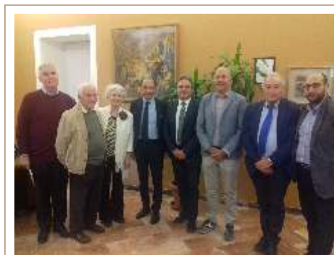
Incontro preliminare al palazzo comunale di Sambuca di Sicilia